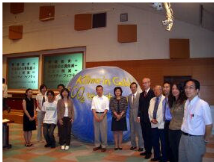
Abbildung 7: Der Klimaballon in Japan.

Checklisten und Hinweise zur Umsetzung von Energiespar- bzw. Klimaschutzprojekten an Schulen gibt es in zahlreichen Publikationen (siehe Literaturliste).