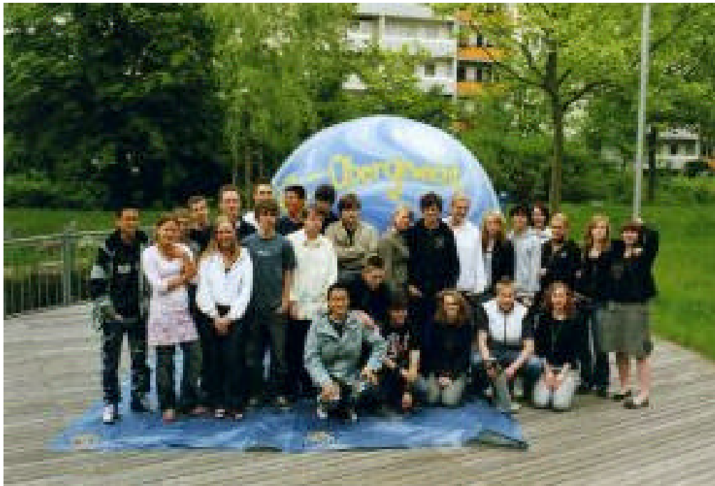
Abbildung 1: Der Klimaballon an der Bernhard-Lichtenberg-Oberschule in Berlin-Lichtenberg.