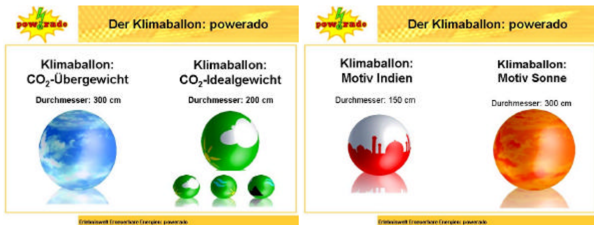
Abbildung 2: Die Klimaballons.