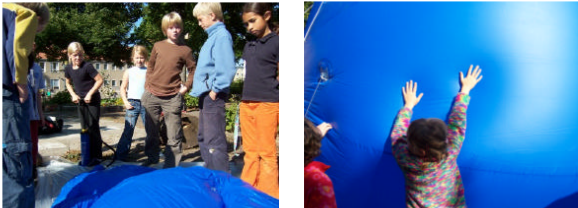
Abbildung 5: Klimaballonaktionen - das sollten die Kinder nicht machen.

Abbildung 3 und 4: Klimaballon-Aktion an der Freien Montessorischule in Berlin-Köpenick – das dürfen die Kinder machen.